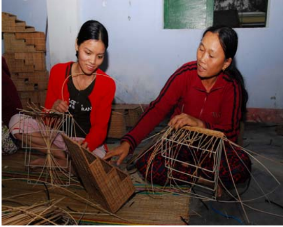
Hình 4: Lớp đào tạo nghề tại huyện Núi Thành, tháng 3/2008