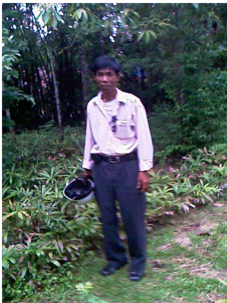
Figure 1: Thăm vườn trồng mây

Việt Nam là một trong những nước chính xuất khẩu mây và các sản phẩm mây. Hiện tại Việt Nam có nguồn mây tự nhiên ở các tỉnh miền núi Trung bộ như Nghệ An, Quảng Bình, Quảng Trị, Quảng Nam, Quảng Ngãi, Kon Tum và Bình Định. Tuy nhiên, nguồn nguyên liệu tự nhiên bị khai thác bừa bãi và có nguy cơ cạn kiệt vì việc khai thác mây tre theo phương thức bền vững chưa được quan tâm. Nguồn nguyên liệu tự nhiên không đủ đáp ứng nhu cầu sản xuất trong nước và xuất khẩu. Vì thế các công ty địa phương tìm nguồn cung cấp với số lượng lớn và rẻ từ Cambodia và Lào. Họ cũng bắt đầu quan tâm tới trồng mây ở vùng đất bằng và ngoài vườn.