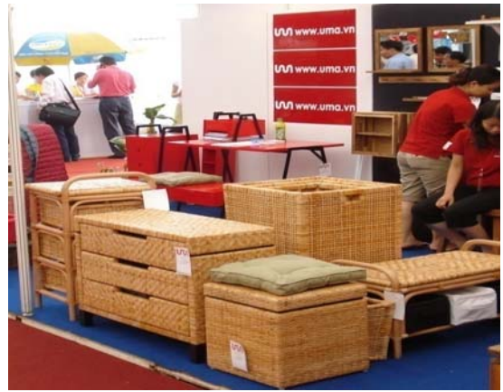
Hình 5: Các sản phẩm theo thiết kế của dự án được trưng bày tại Hội chợ đồ nội thất, TP HCM, tháng 10/2008