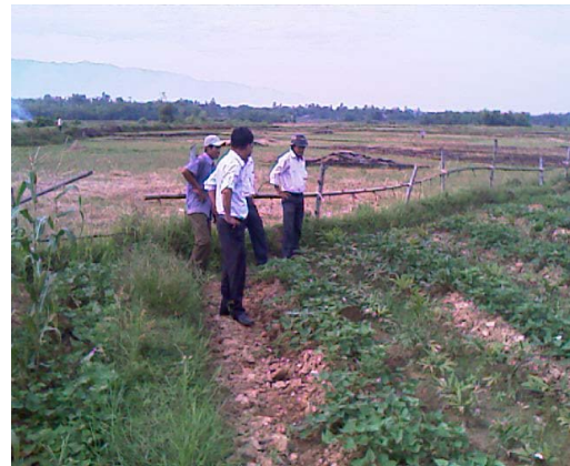
Hình 3: Giám sát việc trồng mây, tháng 9/2008