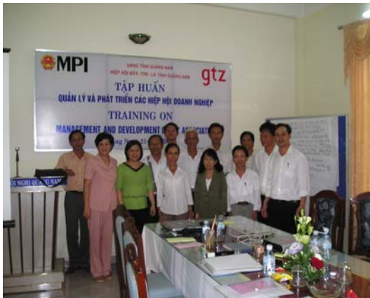
Hình 2: Khóa đào tạo về Quản lý hiệp hội, tháng 5/2007